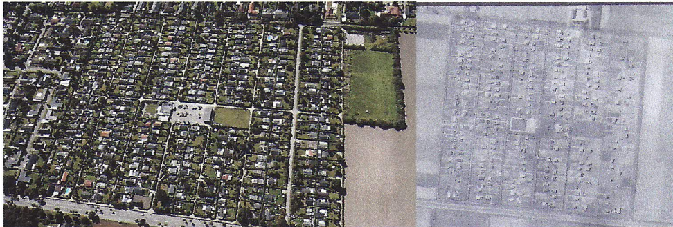
(Foreningen sommeren 2016)